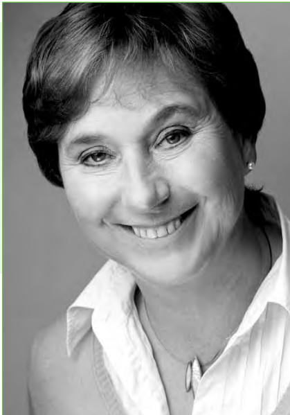
Integrative Lerntherapeutin FiL, Mitarbeiterin am Landesinstitut für Lehrerbildung Brandenburg und der Universität Potsdam