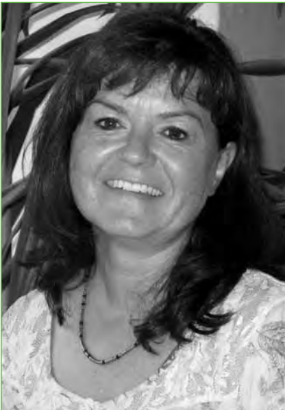
Lehrerin, Integrative Lerntherapeutin FiL an den Schulen im Projekt in Moabit und bei contact Jugendhilfe und Bildung gGmbH Berlin