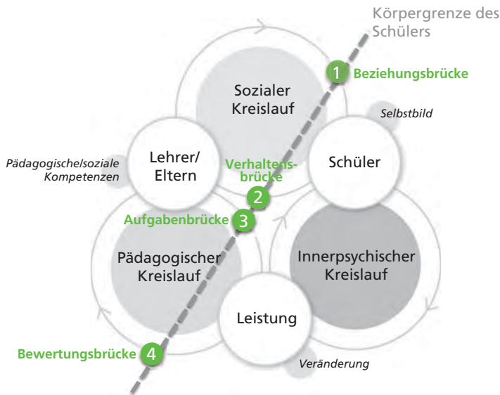
Abb. 2: Wirkungsgefüge des Lernens (Strukturmodell) nach Helga Breuninger; Betz/Breuninger: Teufelskreis Lernstörungen, 1998

Das von Helga Breuninger und Dieter Betz entwickelte und von Helga Breuninger mehrfach optimierte Konzept der integrativen Lerntherapie betrachtet das Lernen als systemischen Prozess. Die Zusammenhänge werden in dem Modell „Wirkungsgefüge des Lernens“ dargestellt; sh. Grafik Abb. 2.